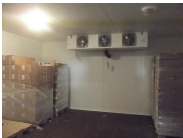
Chambre froide négative Permet une augmentation du volume de stockage des denrées surgelées