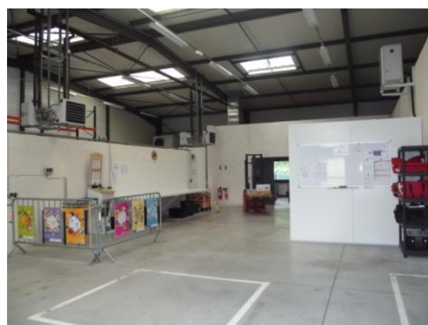
Salle de préparation Lieu de distribution des denrées aux associations