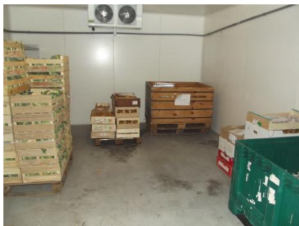
Chambre froide positive Augmentation du volume de stockage permettant une meilleure diversité des denrées