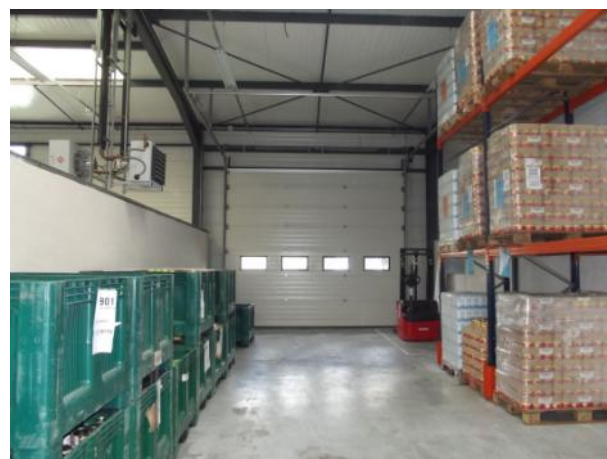
Entrepôt n°2 Stockage sécurisé des denrées sèches et de la collecte